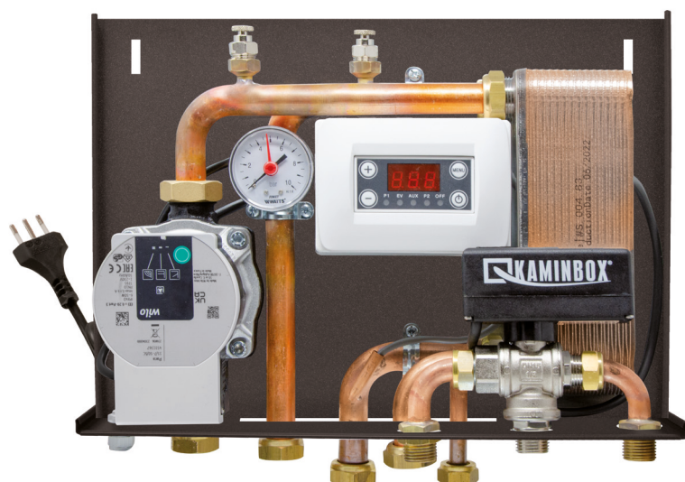
Dimensioni 10 x 25 x 37 cm (PxBxH)