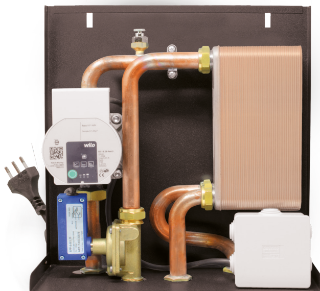
Dimensioni 14,5 x 33 x 39 cm (PxBxH)